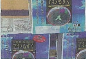
日光工場で生産される「アミノもずく」

日光工場は、敷地面積が約1000平方メートル、鉄骨2階建ての工場だ。食品製造業の工場として、ホクガンは、敷地面積が約1000平方メートル、鉄骨2階建ての工場だ。