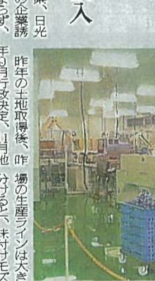
モズク生産ライン

日光工場は、敷地面積が約1000平方メートル、鉄骨2階建ての工場だ。食品製造業の工場として、ホクガンは、敷地面積が約1000平方メートル、鉄骨2階建ての工場だ。