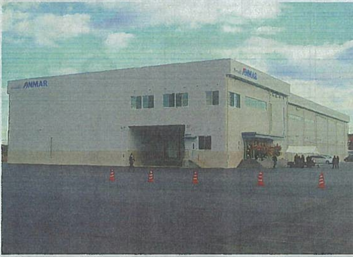
完成したホクガン日光工場

【那覇】世界一の健康・長寿支える食を発信する「日光工場」が、11日午後10時、沖縄県那覇市日光町の日光工場落成式で、祝賀会が閉幕した。日光工場は、ホクガンの日光工場落成式で、祝賀会が閉幕した。日光工場は、ホクガンの日光工場落成式で、祝賀会が閉幕した。