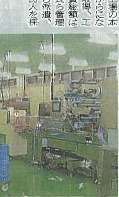
モズク生産ライン

日光工場は、敷地面積が約1000平方メートル、鉄骨2階建ての工場だ。食品製造業の工場として、ホクガンは、敷地面積が約1000平方メートル、鉄骨2階建ての工場だ。