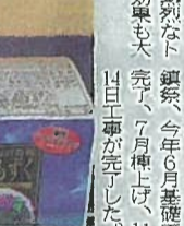
日光工場で生産される「アミノもずく」

日光工場は、敷地面積が約1000平方メートル、鉄骨2階建ての工場だ。食品製造業の工場として、ホクガンは、敷地面積が約1000平方メートル、鉄骨2階建ての工場だ。