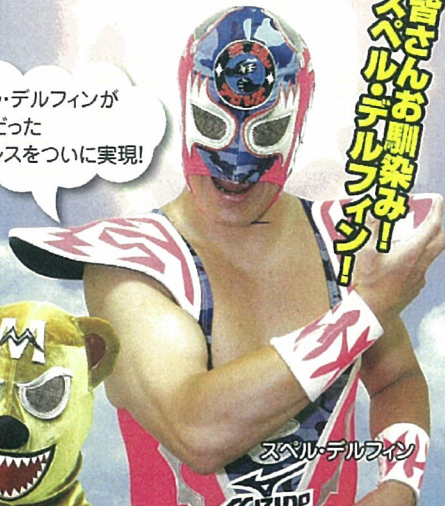
スペル・デルフィン