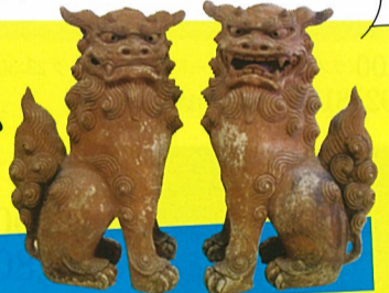
◎沖縄県の首里城公園内の施設に展示されていたもので、高さ110cm。(所有・管理:海洋博記念財団)